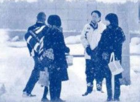
高校生との意見交換