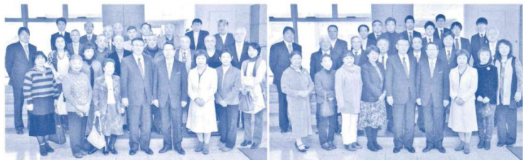
～知事、副知事と傍聴者との記念撮影～（平成30年2月議会）