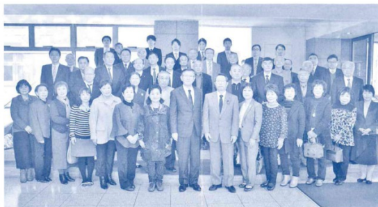
～知事と副知事との記念撮影～（平成30年12月議会）