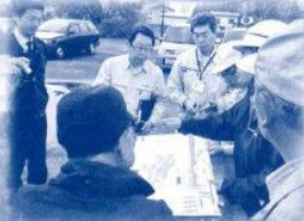
福部内川水害対策の現地調査

地域防災対策の強化 充実と誰しものが元 気で活躍できる健康長 寿・地域共生社会の 確立