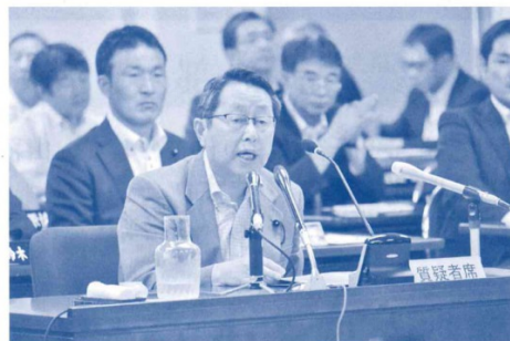
～全員協議会・防衛省幹部との質疑～ 「イー・ジェス・アショア」について（平成30年7月）