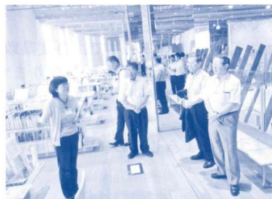
～教育公安委員会県外調査～ 富山市立図書館にて（平成30年7月）