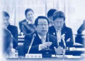
雇用の創出を訴える