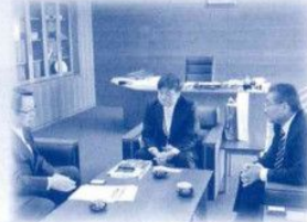
東京農大大学長との意見交換

廃校舎の利活用を視 野に入れた実習施設 の設置等、受入体制の 確立による学部誘致 運動の展開