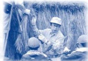
刈り取りの実体験