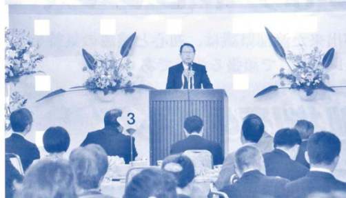
～県政報告会～（平成30年4月）