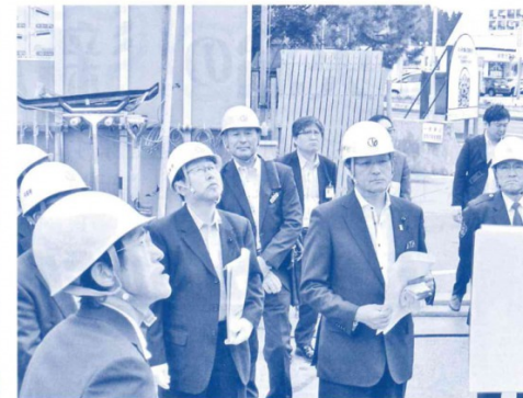
～教育公安委員会県内調査～ 横手警察署改築現場にて（平成30年6月）