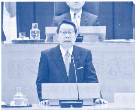
～代表質問～（平成30年2月議会）