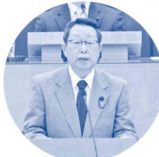
～一般質問～（平成30年12月議会）