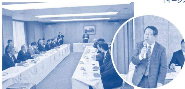
～道路の整備等に関する国土交通省等の五県合同意見交換会にて～ 秋田自動車道の4車線化について事業促進を要請（平成30年11月）