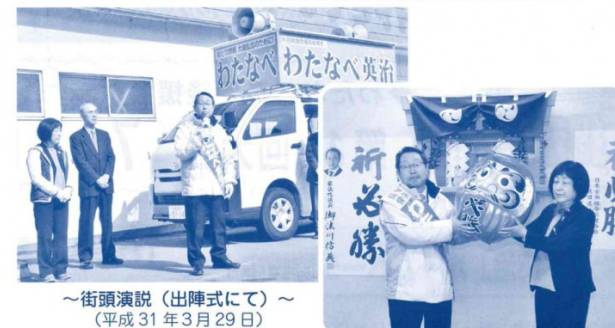
～街頭演説（出陣式にて）～ （平成31年3月29日）