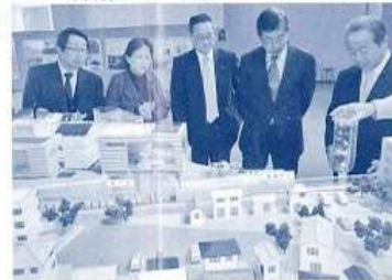
〈神田川流域洪水対策の善福寺川取水場視察〉 （平成25年1月会派県外調査）