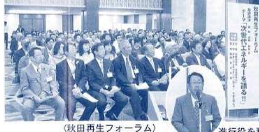
〈秋田再生フォーラム〉 （平成23年9月） 進行役を務める