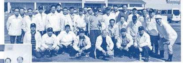
〈国道13号クリーンアップ〉 （平成24年7月）