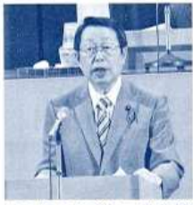
〈23年6月議会一般質問〉