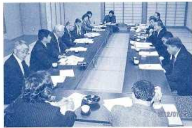
〈秋田内陸縦貫鉄道に関する意見交換〉 （平成24年1月）