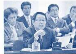
〈24年12月議会総括審査〉 （平成24年12月）