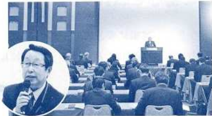
〈全国都道府県議会議員研修会にて質問〉 （平成24年11月）