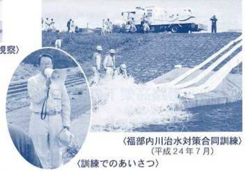
〈福部内川治水対策合同訓練〉 （平成24年7月） 〈訓練でのあいさつ〉