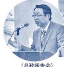
〈県政報告会〉 （平成24年4月）