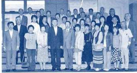
〈23年6月議会一般質問傍聴者〉