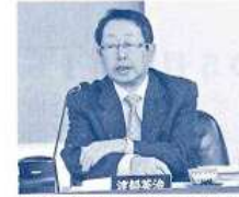
〈決算特別委員会副委員長〉 （平成23年11月）