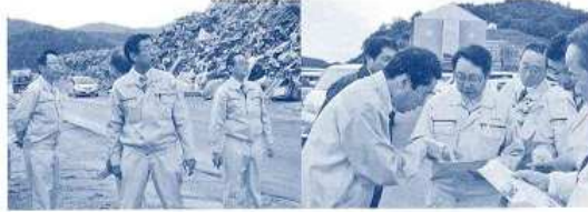
〈宮城県被災地視察〉 （平成23年10月会派県外調査）