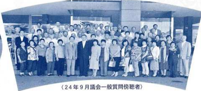
〈24年9月議会一般質問傍聴者〉