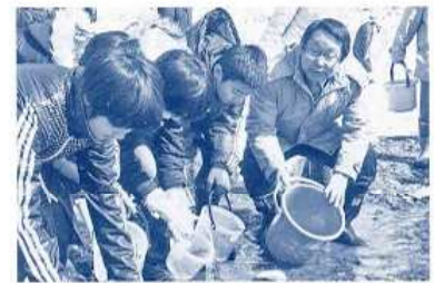
〈花館のサケまつり事業・サケの稚魚放流〉 （平成25年3月）