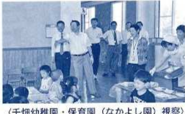
〈千畑幼稚園・保育園（なかよし園）視察〉 （23年7月教育公安委員会県内調査）