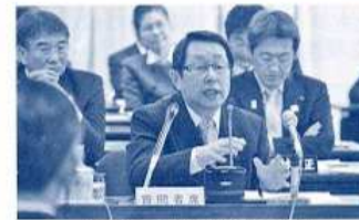
〈25年2月議会総括審査〉 （平成25年3月）