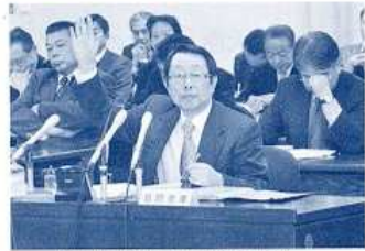
〈24年2月議会総括審査〉 （平成24年2月）