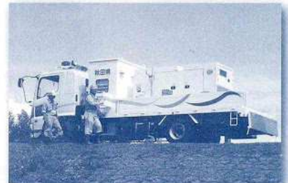
仙北地域振興局に常備された排水ポンプ車

花火特区や大曲の花火を中核とした観光ネットワークの構築の他、花火ミュージアムなど花火にこだわった事業を推進していきます。