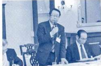
〈北海道・東北県議会議員研修分科会にて事例発表〉 （平成24年2月）