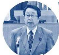
〈24年9月議会一般質問〉