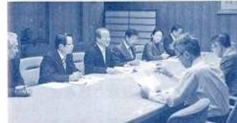
〈会派による知事への政策提言〉 （平成23年11月）