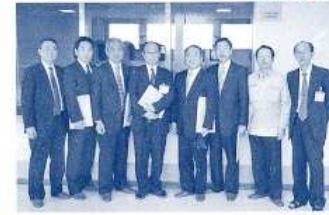
〈大仙美郷クリーンセンターがれき受入前視察〉 （平成24年4月会派県内調査）