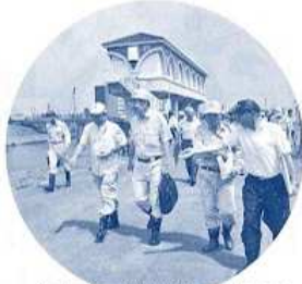
〈福部内川洪水対策現地調査〉 （平成23年8月）