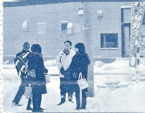
▲高校生と対話。若者が希望がもてるよう! (タカナギグラマート中通店前にて)