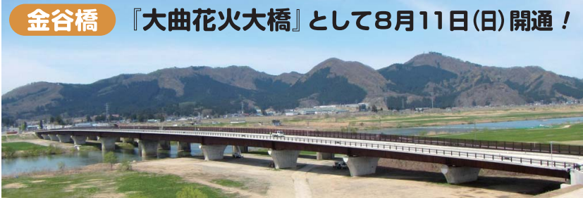
金谷橋 『大曲花火大橋』として8月11日(日)開通! 開通間近の花火大橋(通称) 今後の安全確保と地域経済の活性化に期待!

仙北組合総合病院 改築 来年の5月開院! ◆病床数/437床 ◆地上8階 ◆地下1階 ◆屋上ヘリポート