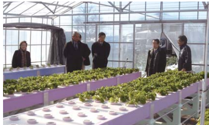
社会福祉法人 和光市社会福祉協議会 (水耕栽培プラント)