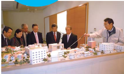
神田川・環状七号線地下調節池 善福寺川取水施設