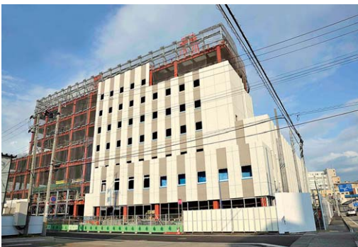
着々と進む病院棟の工事状況 (平成25年7月現在・大盛橋付近より撮影)